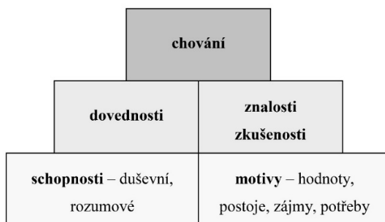
Obrázek 1 – Hierarchický model složek kompetence (Veteška et al., 2008)

schopnosti. Kompetence se často týkají celé osobnosti člověka, což potvrzuje Duisman (2005), který popisuje základní složky kompetence – chování, poznávání a prožívání.